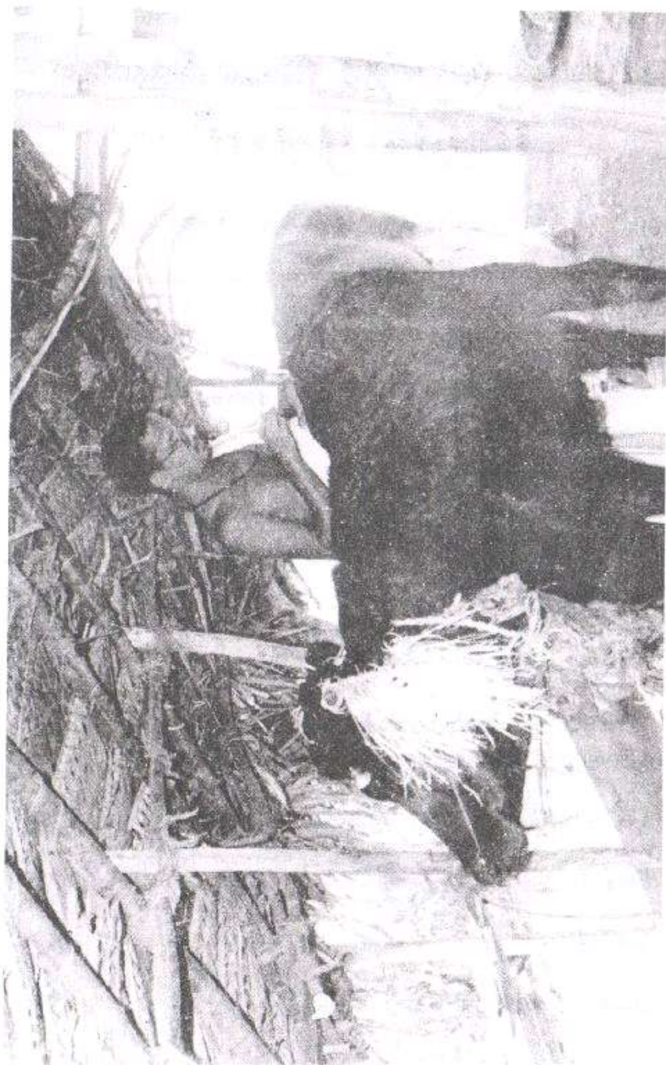
மதுரபுரி ஆஸ்ரம கோ ஸாலாவில் ஸ்ரீ குருஜி